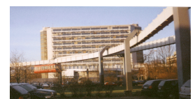
das Mathematikgebäude ist das höchste Gebäude auf dem Campus Nord und daher leicht zu finden

Noch Fragen: vorkurs@math.tu-dortmund.de