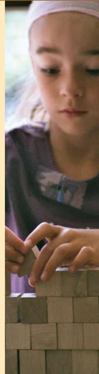
Herausgeber: KITZ.do, Rheinlanddamm 201, 44139 Dortmund · Redaktion: Dr. Ulrike Martin (verantwortlich), Kerensa Lee · Kommunikationskonzept, Produktion, Satz, Druck: Dortmund-Agentur – 05/2008